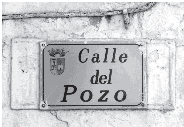
Placa actual de la calle del Pozo colocada sobre una antigua con el nombre anterior de calle de José Antonio.

La calle del Pozo se ha caracterizado a lo largo de su historia por presentar una importante actividad comercial, artesanal e industrial. Es una vía de unos 850 metros de longitud que atraviesa prácticamente el caso urbano de Munera de sur a norte, aunque en sus últimos tramos va virando hacia el oeste. Comienza la numeración de las casas en el cruce con la calle de Cervantes, donde la fuerte pendiente que queda al mediodía conduce inmediatamente hacia las afueras del pueblo. Tras numerosas intersecciones a uno y otro lado, la calle finaliza cuando llega al ramal de carretera N430a, entre las instalaciones del Colegio de Educación Infantil y Primaria Cervantes y la gasolinera.